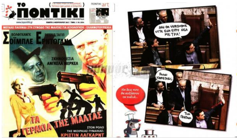
Η εβδομαδιαία σατιρική εφημερίδα «Ποντίκι» δίνει τη δική της άποψη στην επικαιρότητα...