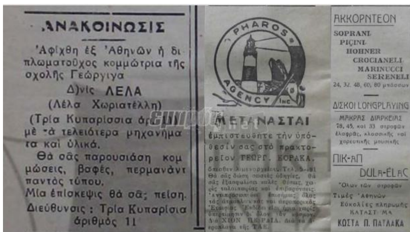
Φεβρουάριος 1956: Διαφημίσεις μιας αξέχαστης εποχής. Άφιξη διπλωματούχου κομμώτριας, αναχωρήσεις μεταναστών αλλά και όργανα μουσικής...

«Η Ελλάδα μεγαλούργησε επί δραχμής» λέει ο Ξυδάκης . Ναι, αλλά επί ευρώ πάει στο διάστημα!