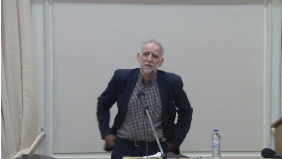
Ο Συνήγορος του Παιδιού, Γ. Μόσχος, στη Μυτιλήνη