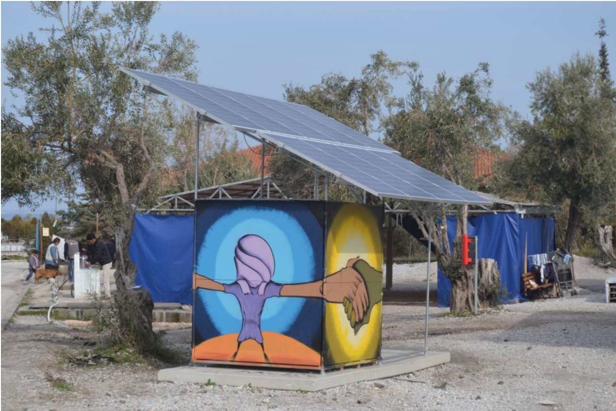
Νηπιαγωγείο στον Καρά Τεπέ, προτείνει ο Συνήγορος του Πολίτη

Με βάση τις παραπάνω διαπιστώσεις, ο Συνήγορος του Πολίτη κρίνει ότι είναι σκόπιμο το Υπουργείο Παιδείας και η Περιφερειακή Διεύθυνση Εκπαίδευσης να δώσουν ιδιαίτερη προσοχή στις παρακάτω ενέργειες: