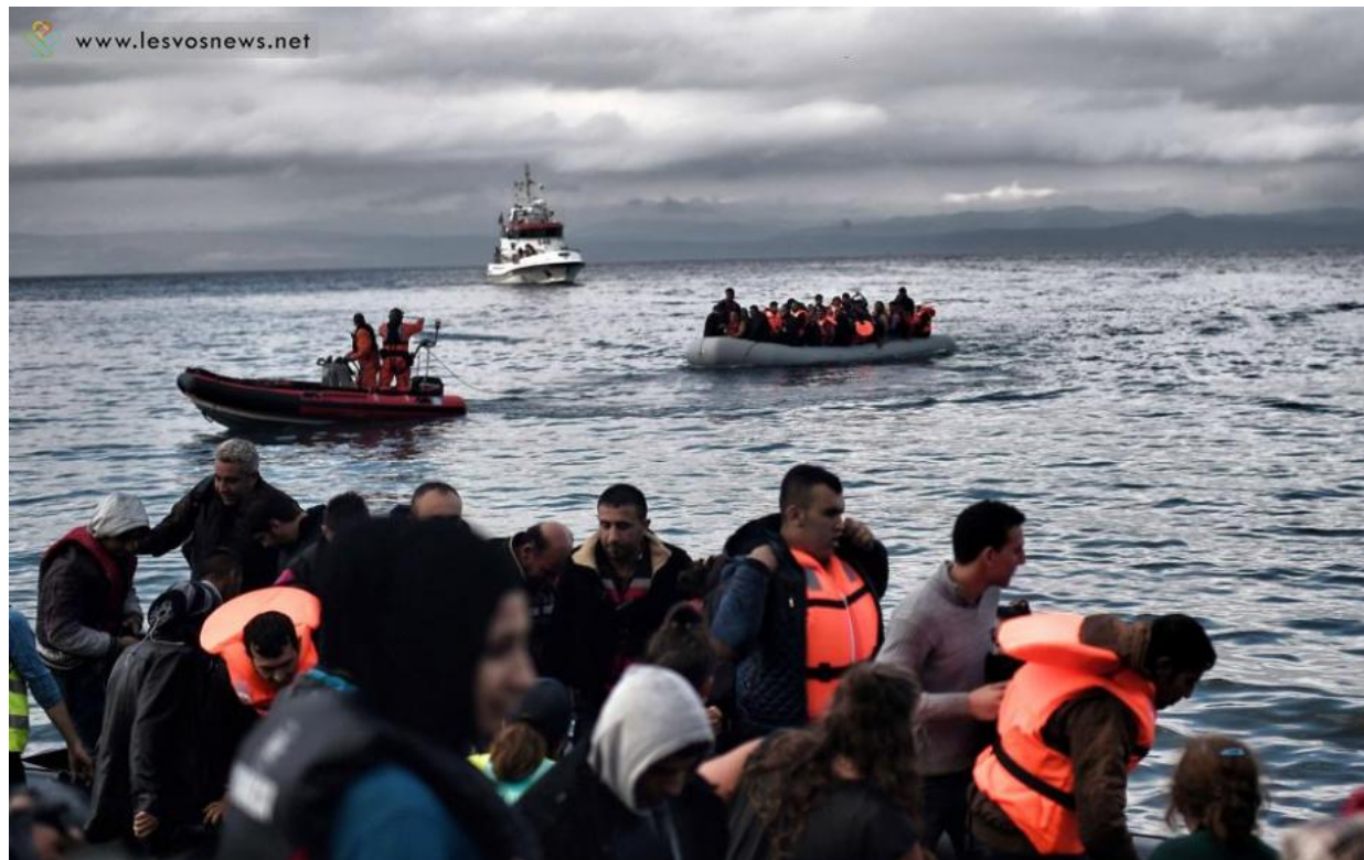
Αποστολή στη Τουρκία / του Στρατή Μπαλάσκα

Αυξημένες, σε σχέση με το αμέσως προηγούμενο διάστημα, δείχνουν να είναι οι ροές μεταναστών και προσφύγων στα νησιά του βορείου Αιγαίου. Έως σήμερα (15 Μαΐου) έχουν φτάσει 909 άτομα, όταν όλο τον Απρίλιο οι αφίξεις έφτασαν τις 1028.