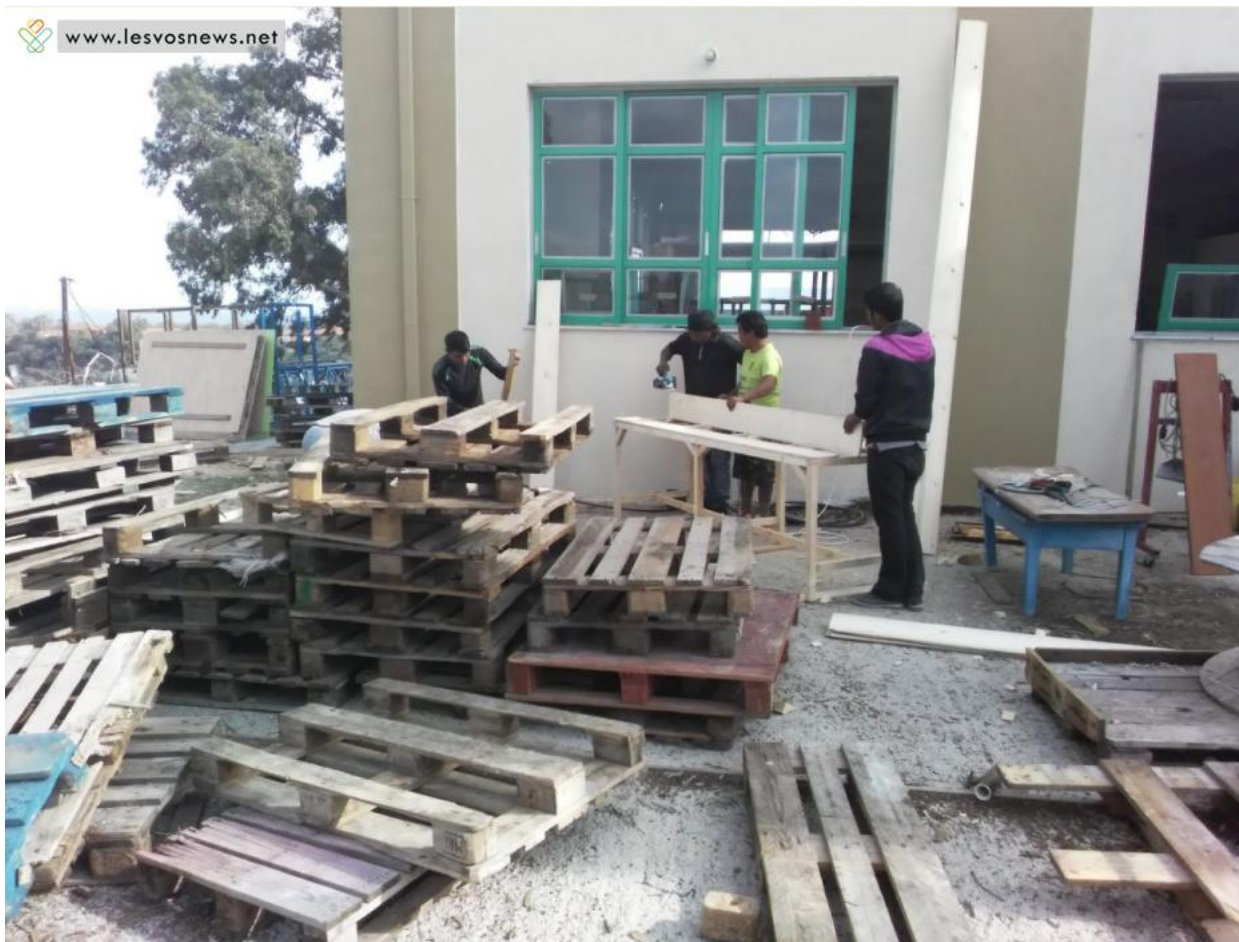
Άχρηστες παλέτες μεταμορφώνονται σε τραπέζια ή καθίσματα για την αίθουσα προβολών. Εξαιρετικοί μαραγκοί από το Νεπάλ