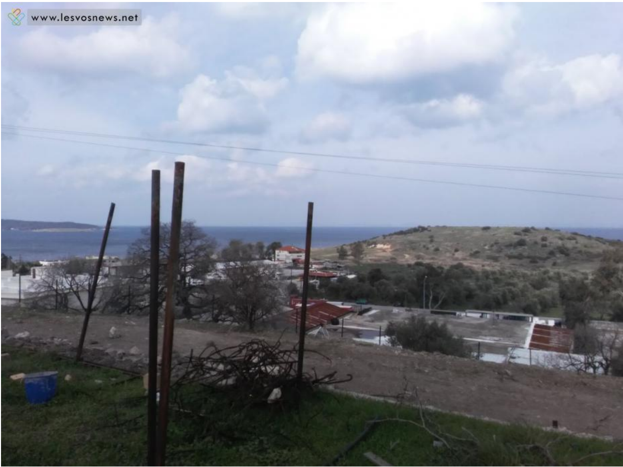
Η θέα είναι εξαιρετική