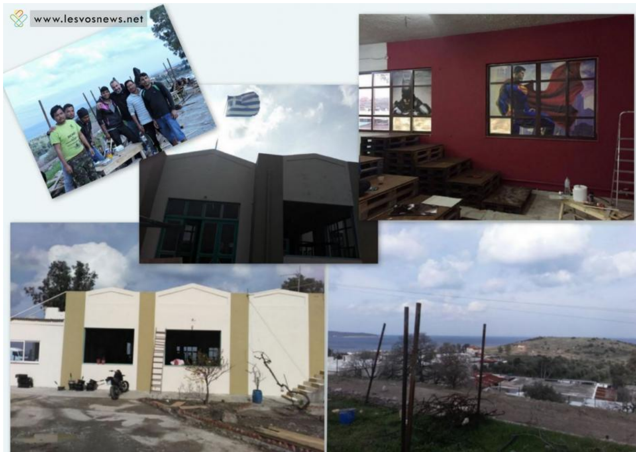
Ένα βιομηχανικό κτήριο στην περιοχή του Καρά Τεπέ παίρνει νέα ζωή. Κι όταν λέμε παίρνει ζωή κυριολεκτούμε.