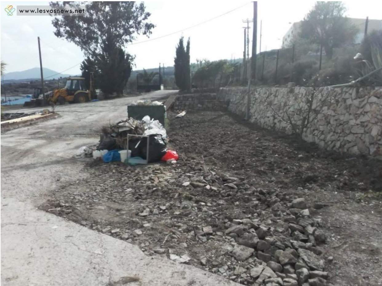
Χώρος φύτευσης αρωματικών φυτών - Από την άλλη πλευρά θα τοποθετηθούν οι δύο αίθουσες διδασκαλίας