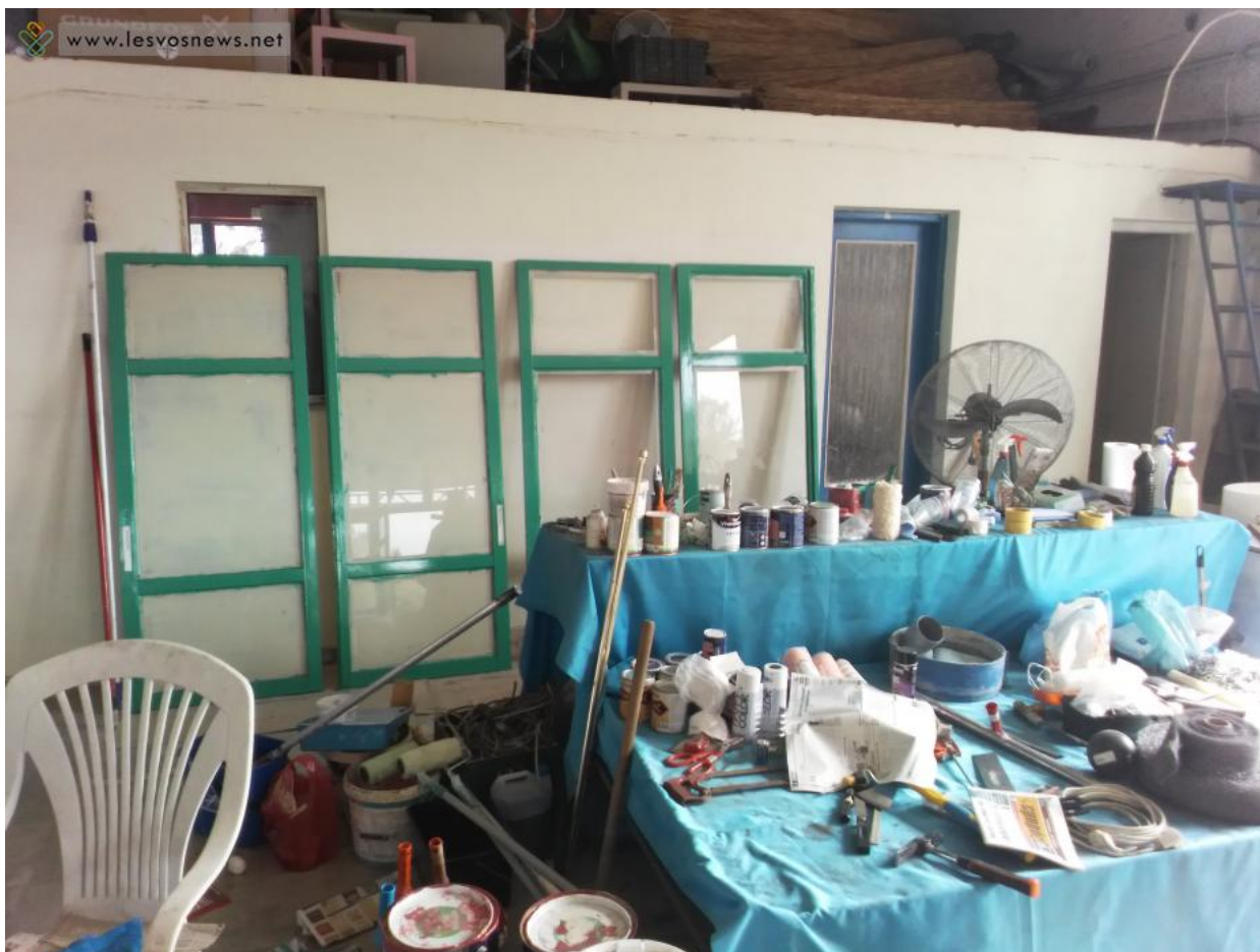
Εργασίες ελαιοχρωματισμού στο εσωτερικό του κτηρίου