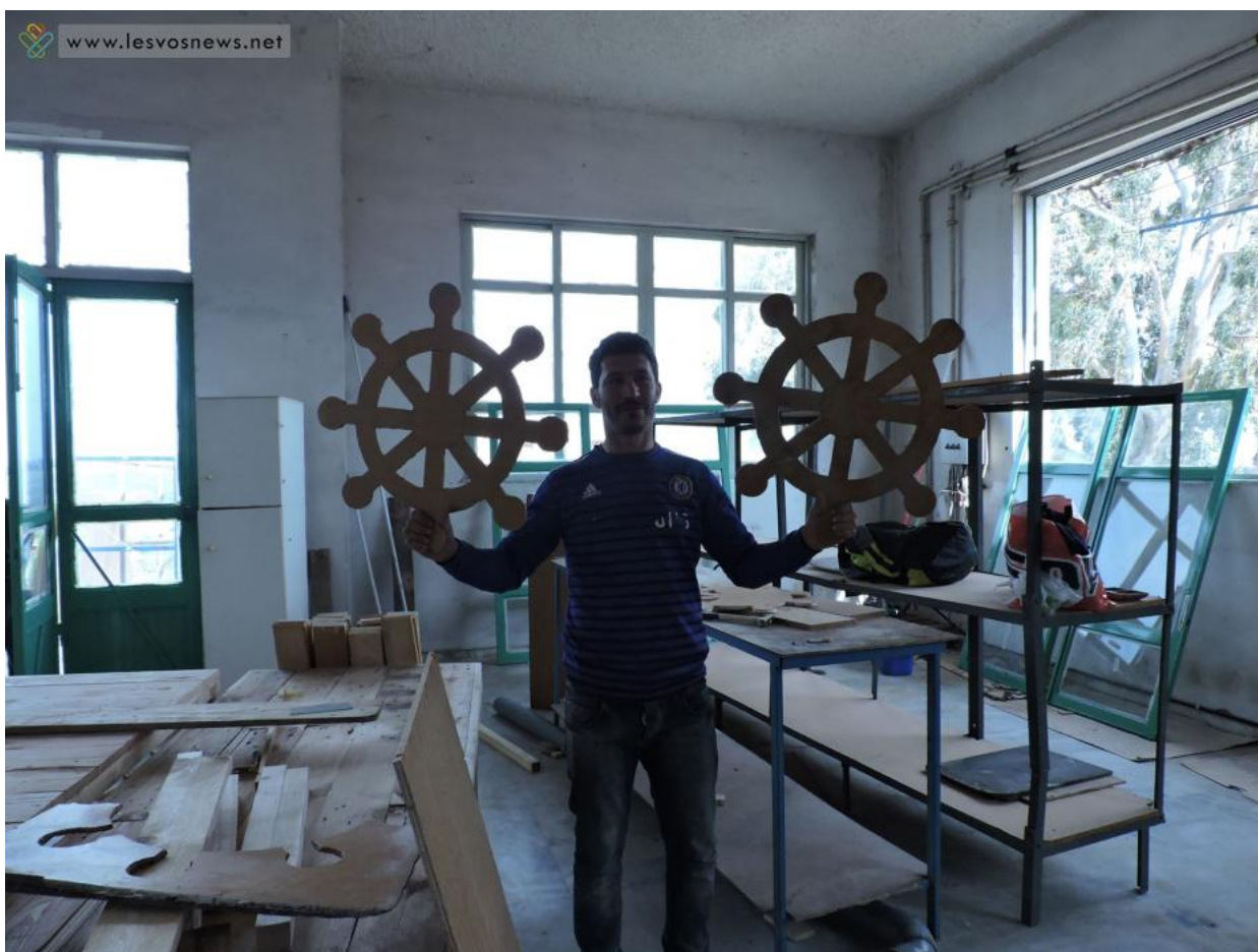
Κατασκευή διακοσμητικών για το χώρο του εστιατορίου