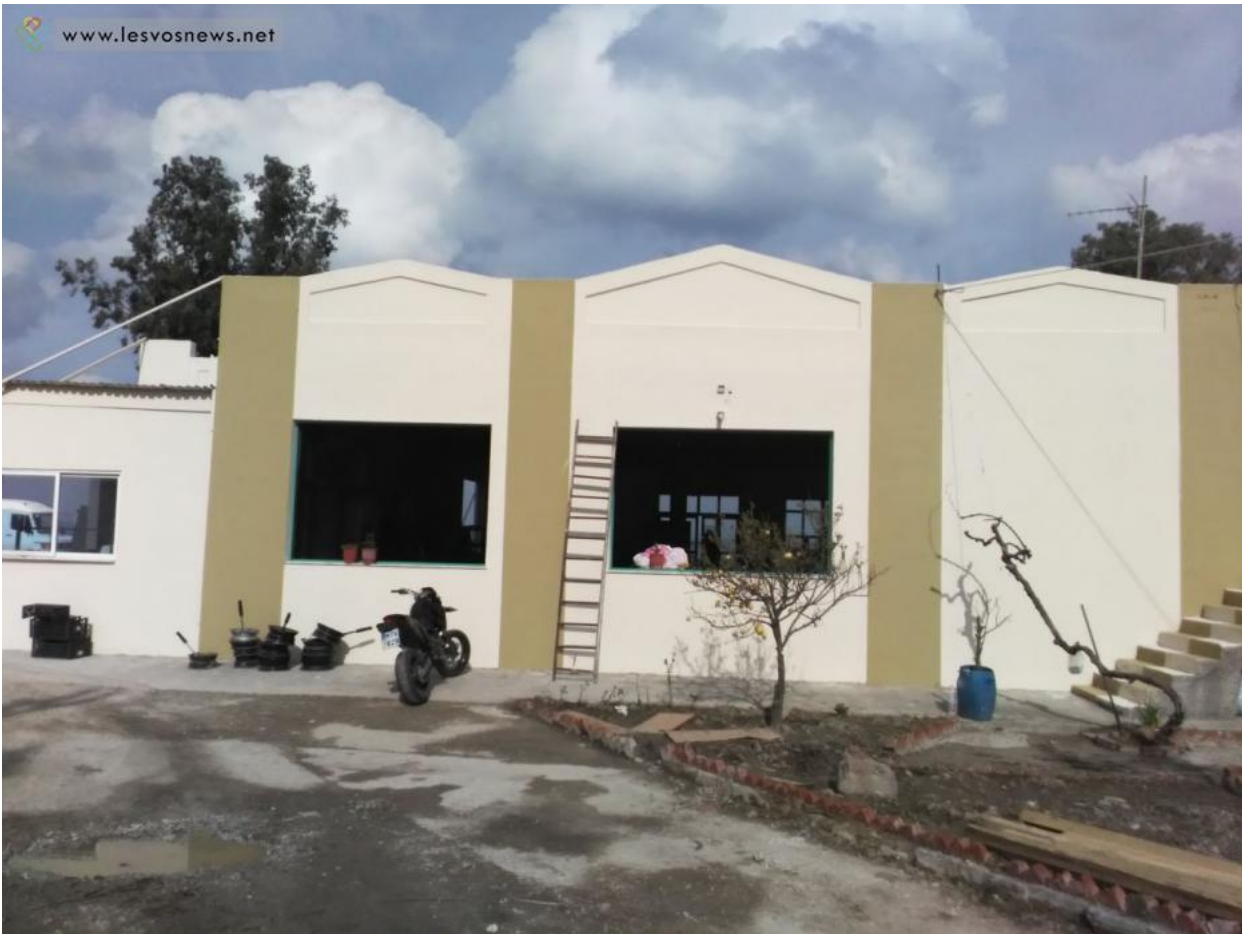
Η πρόσοψη του κτηρίου