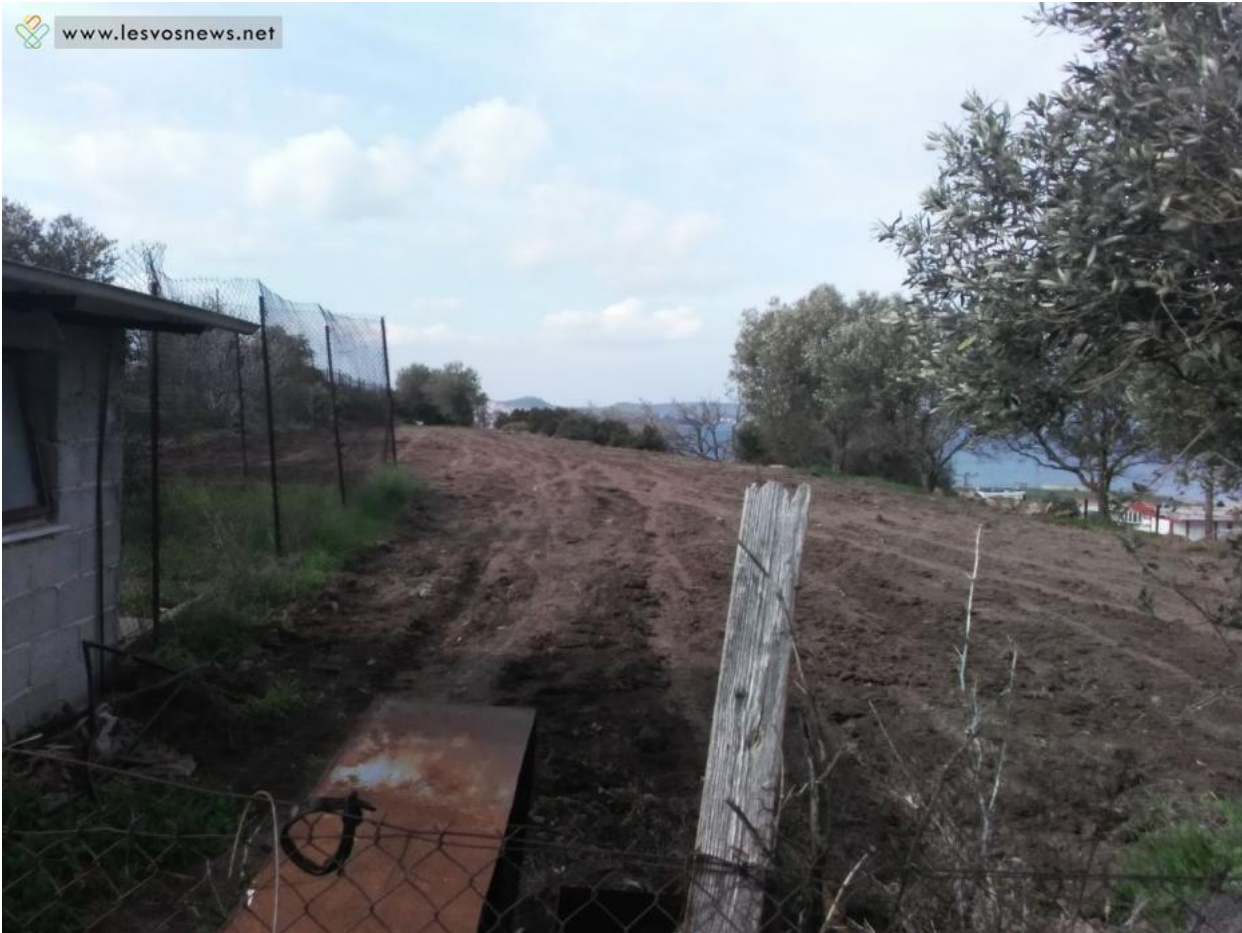
Χώρος καλλιέργειας κηπευτικών και άλλων