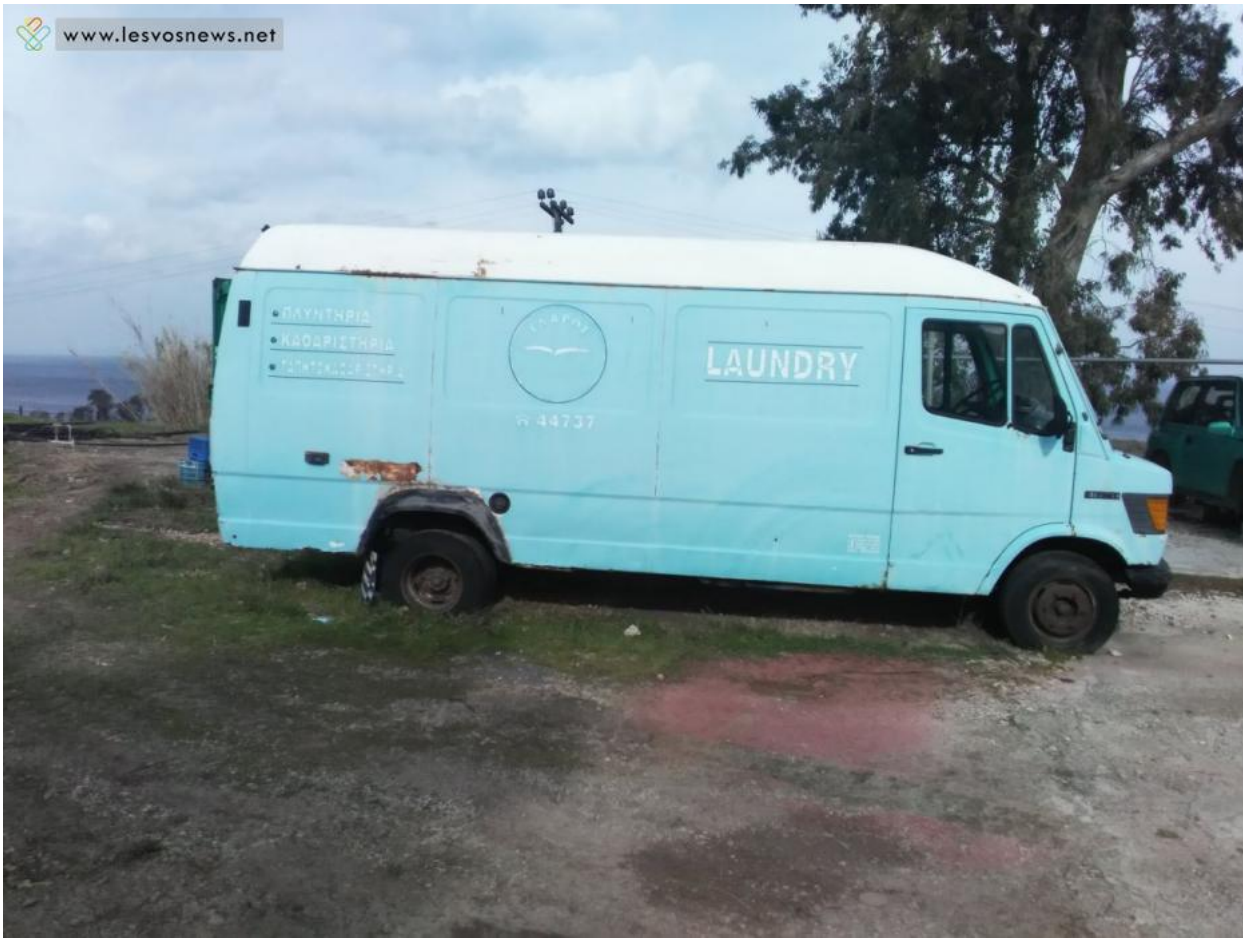
Αυτό θα γίνει βιβλιοθήκη!