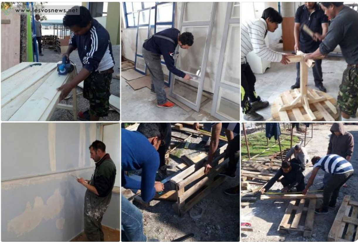
Σε πλήρη εξέλιξη οι εργασίες για τη διαμόρφωση του κτήριου