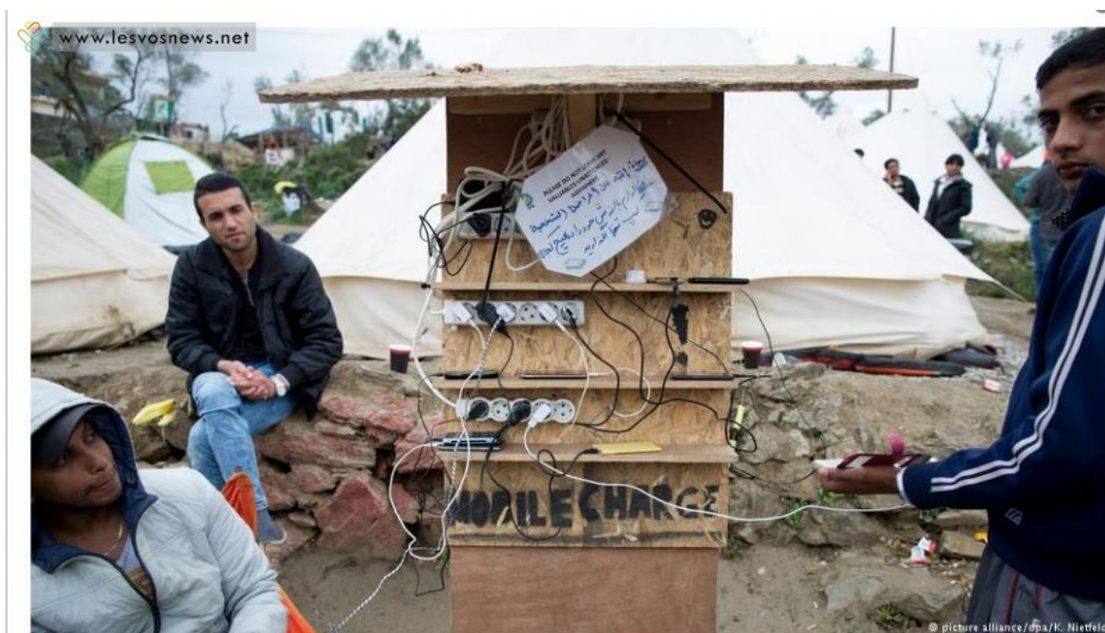
Σταθμός φόρτισης κινητών στον καταυλισμό της Μόριας

Πλήξη και απόγνωση κυριαρχούν στην καθημερινότητα των προσφύγων στη Μόρια της Λέσβου. Σχεδόν εναν χρόνο από την υπογραφή της ευρωπαϊκής προσφυγικής συμφωνίας οι πρόσφυγες δεν έχουν προοπτική. Ο ήχος από τις γεννήτριες πετρελαίου συνοδεύει όποιους περνούν την κεντρική πύλη του καταυλισμού στη Μόρια.