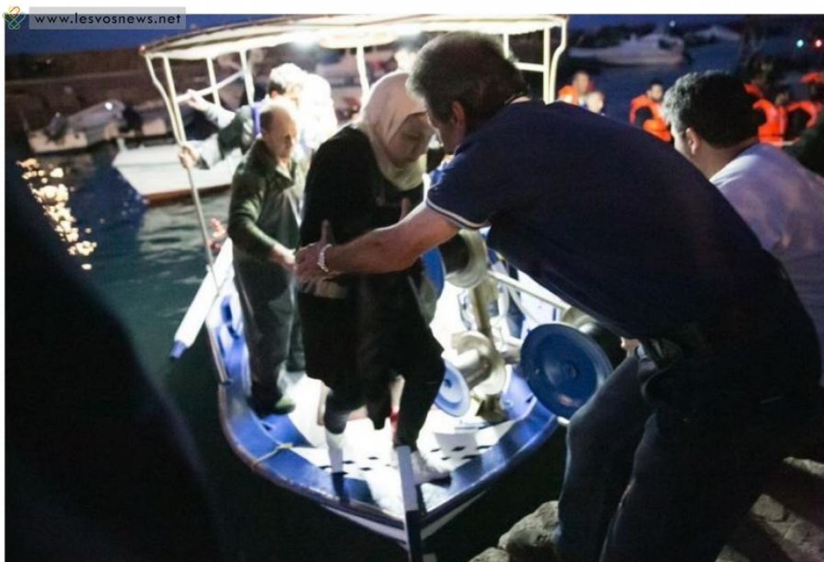
Ψαράδες βοηθούν γυναίκες και παιδιά που διέσωσαν από βάρκα που βυθιζόταν, να βγουν στο λιμάνι.