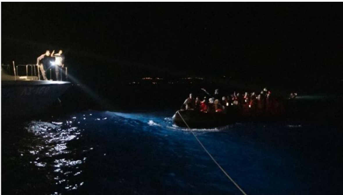
Έλληνες λιμενικοί ρίχνουν φως σε βάρκα με πρόσφυγες που φθάνει στη Λέσβο.