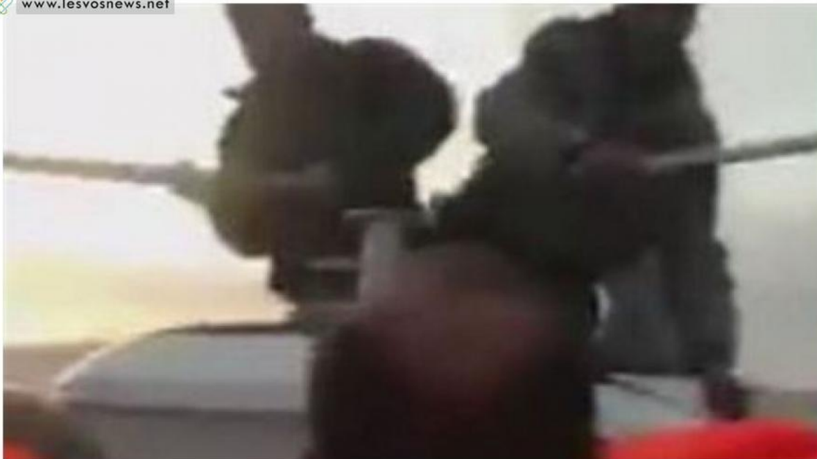
Στιγμιότυπο από το βίντεο που βρέθηκε στην κατοχή του BBC

Ερασιτεχνικό βίντεο που δόθηκε στο BBC δείχνει άνδρες της τουρκικής ακτοφυλακής να χτυπούν με κοντάρια μετανάστες που βρίσκονταν σε φουσκωτό προσπαθώντας να περάσουν το Αιγαίο.