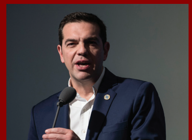
(Δηλώσεις Έλληνα Πρωθυπουργού Αλέξη Τσίπρα, μετά την ολοκλήρωση της 2ης Συνόδου Μεσογειακών/Νότιων Χωρών της ΕΕ στη Λισαβόνα, 27-28.1.2017)

«Η Ευρώπη έχει ανάγκη τον ευρωπαϊκό Νότο, προκειμένου να προχωρήσει σε μία αποτελεσματική διαχείριση της προσφυγικής κρίσης, μέσα στα πλαίσια των ευρωπαϊκών αξιών. Η Ευρώπη έχει, επίσης, ανάγκη τον Ευρωπαϊκό Νότο για να ενισχύσει τον διεθνή και περιφερειακό της ρόλο για την ειρήνη και τη σταθερότητα στην ευρύτερη περιοχή.»